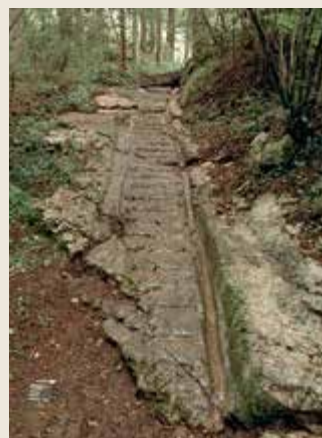
Tronçon de route à rainure médiévale à Tavannes, La Tanne.

2,3 km à l'ouest de Pierre-Pertuis, on observe les vestiges d'une route à rainures médiévale.